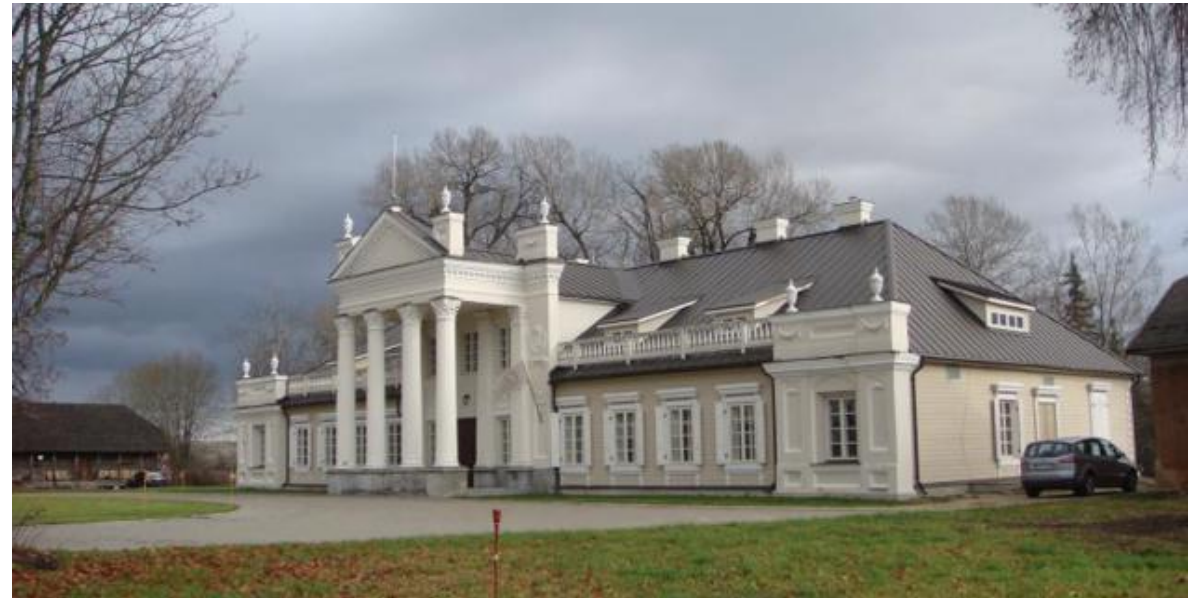
Vidiškių dvaras (XVIII a.)