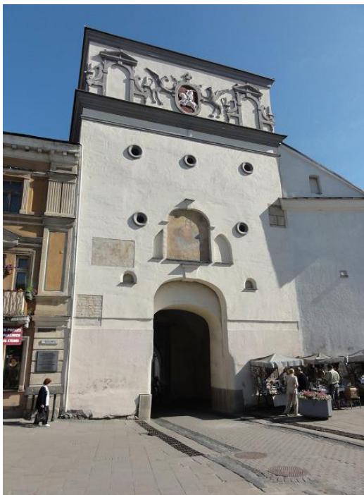
Vilniaus gynybinės sienos Medininkų (Aušros) vartai (XVI a.)

Pasitarę grupėje sąsiuviniuose užrašykite pagrindinius architektūros bruožus.