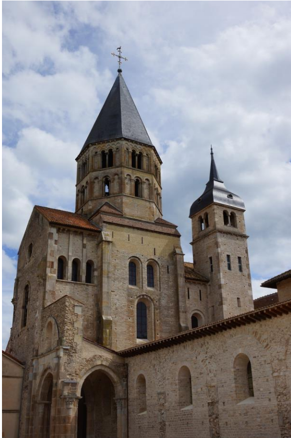
Kliuni. (Prancūzija) Abatijos bažnyčia. 1088-1118 m.

Pasitarę grupėje sąsiuviniuose užrašykite pagrindinius architektūros bruožus.