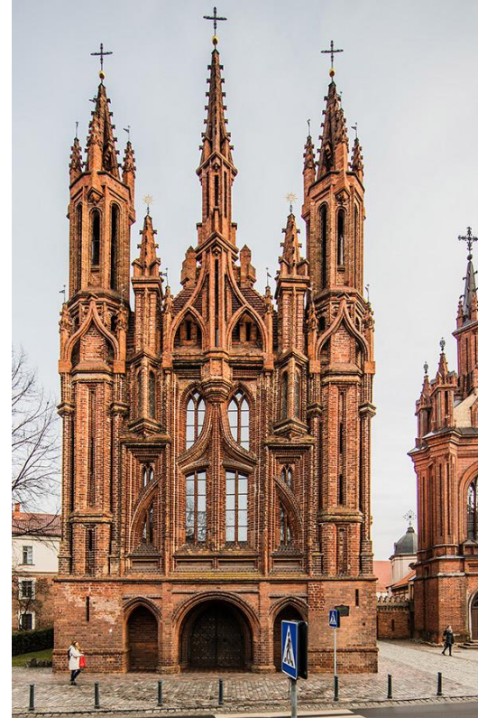
Vėlyvoji gotika. Vilniaus šv. Onos bažnyčia (apie 1500 m. atstatyta po gaisro 1581 m.)