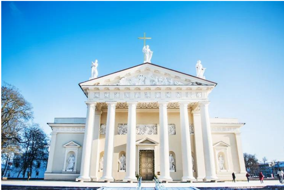
Vilniaus šv. vyskupo Stanislovo ir šv. Vladislovo arkikatedra bazilika (XVIII a.)

Pasitarę grupėje sąsiuviniuose užrašykite pagrindinius architektūros bruožus.