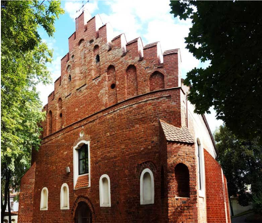
Ankstyvoji gotika. Vilniaus šv. Mikalojaus bažnyčia (XIV a.)

Pasitarę grupėje sąsiuviniuose užrašykite pagrindinius architektūros bruožus.