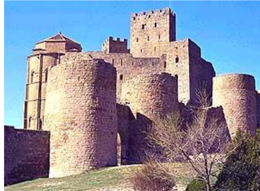
Loare pilis. Prancūzija. 1070 m.