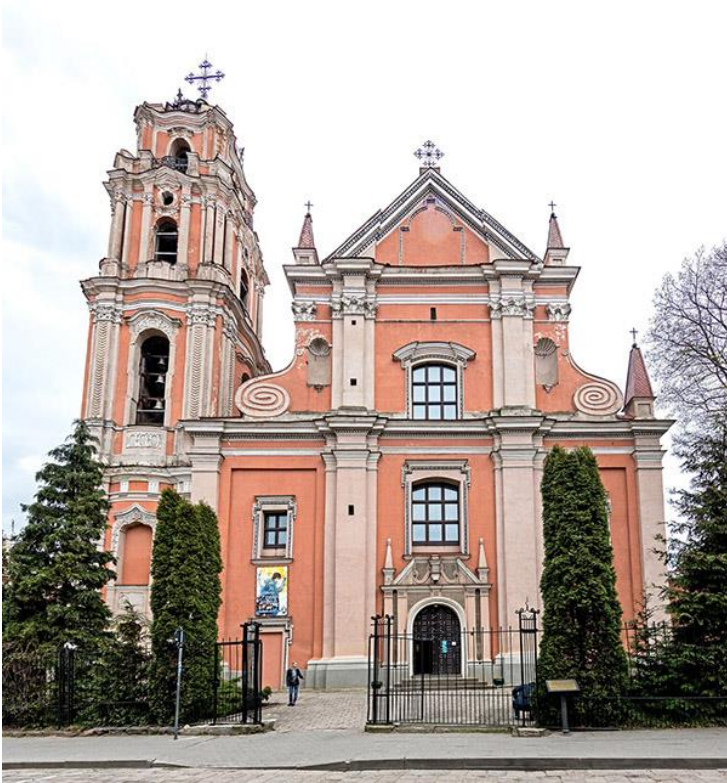
Vilniaus Visų šventųjų bažnyčia (XVII a.)

Pasitarę grupėje sąsiuviniuose užrašykite pagrindinius architektūros bruožus.